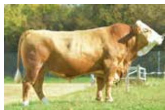
LINIE: Bayer A1A2

V: ENZIAN PP* DE 12 71393433 M: FELLA DE 12 67275210 MV: STEINADLER PP DE 09 37631910