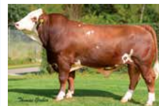
LINIE: Bayer A1A2 Foto: Gruber

V: HANNIBAL PP* DE 05 36412886 M: HANTEL Pp DE 09 44971141 MV: HOFSTERN DE 09 39808275