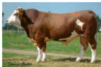
LINIE: Bayer A2-I

V: EXCALIBUR Pp DE 09 39808320 M: 50 DE 09 18192561 MV: WALZER DE 09 18594934