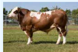
LINIE: Bayer A1A1

V: HEARTBREAKER PS DE 12 71393451 M: STELLA P DE 12 67224149 MV: POLDAU PP DE 12 67126919