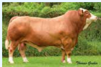
LINIE: Bayer B/A2

V: BARBAROSSA AT 192.175.926 M: K 09 MAJA DE 09 44273273 MV: HOENESS PP* DE 12 60105246