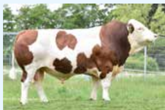
LINIE: Redad A2A2

V: VOTARY P*S DE 09 46894585 M: LOKUS DE 09 45115292 MV: STEINMARDER PP DE 09 42290834