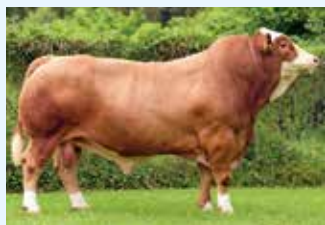
Linie: BAYER B-A2

V: BARBAROSSA 10/605939 M: K 09 MAJA DE 09.44273273 MV: HOENESS 10/603062