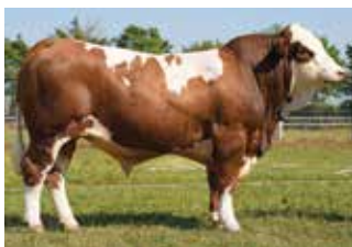
Linie: HAFKE A1A1

V: HEARTBREAKER PS 10/603162 M: STELLA P DE 12.67224149 MV: POLDAU PP 10/403065