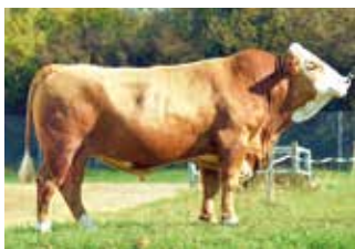
Linie: EMBARGO

V: ENZIAN PP* 10/603159 M: FELLA DE 12.67275210 MV: STEINADLER PP 10/403084