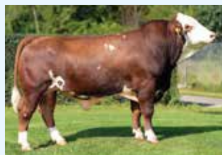
Linie: METZ A1A2

V: HANNIBAL PP 10/603134 M: HANTEL PP DE 09.44971141 MV: HOFSTERN PS 10/403093