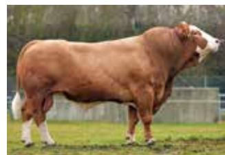
Linie: ZIMBO

V: ZAMBIA 10/603142 M: Pp DE 09.32081120 MV: Gigant Pp 10/603047