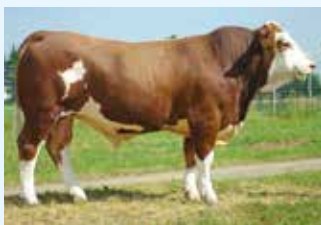
Linie: EMBARGO A2-I

V: EXCALIBUR 10/403092 M: 50 DE 09 181 92 561 MV: WALZER 10/403045